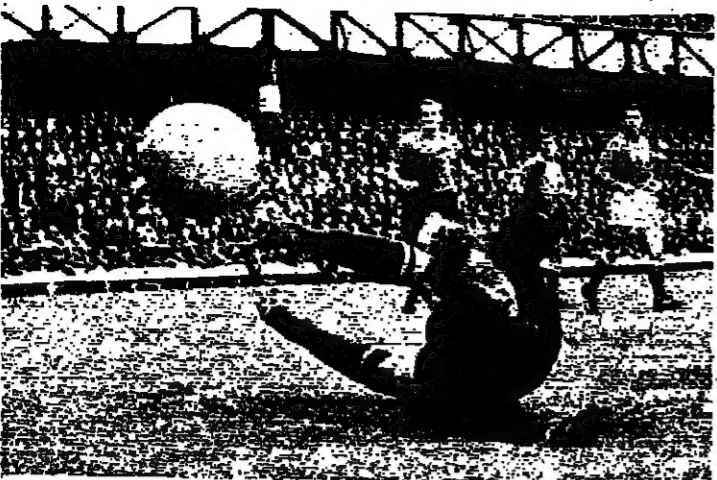
ليف ياشين في إحدى مباريات عام ١٩٥٧. صورة من ترشيح ليف ياشين (نوفوسبي)